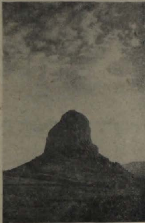
Գավազանի ընդհանուր տեսքը

Ղալինջաքարը գտնվում է Կողբաչայ գետի աջ կողմում, որը հոսում է անմիջապես հարթության վրա բարձրացած բլրի (քարի) լանջով և փաստորեն ծառայում է որպես բնական պատնեշ: Ամրոցն ունի ձվաձև (ավելի շուտ ուղղանկյունու նմանվող) հատակագիծ և ձգվում է արևելքից արևմուտք: Միակ մուտքը գտնվում է արևմտյան կողմում: Շինությունը ամենայն հավանականությամբ երկհարկանի է, շնայած երկրորդ հարկի հատակը չի պահպանվել: